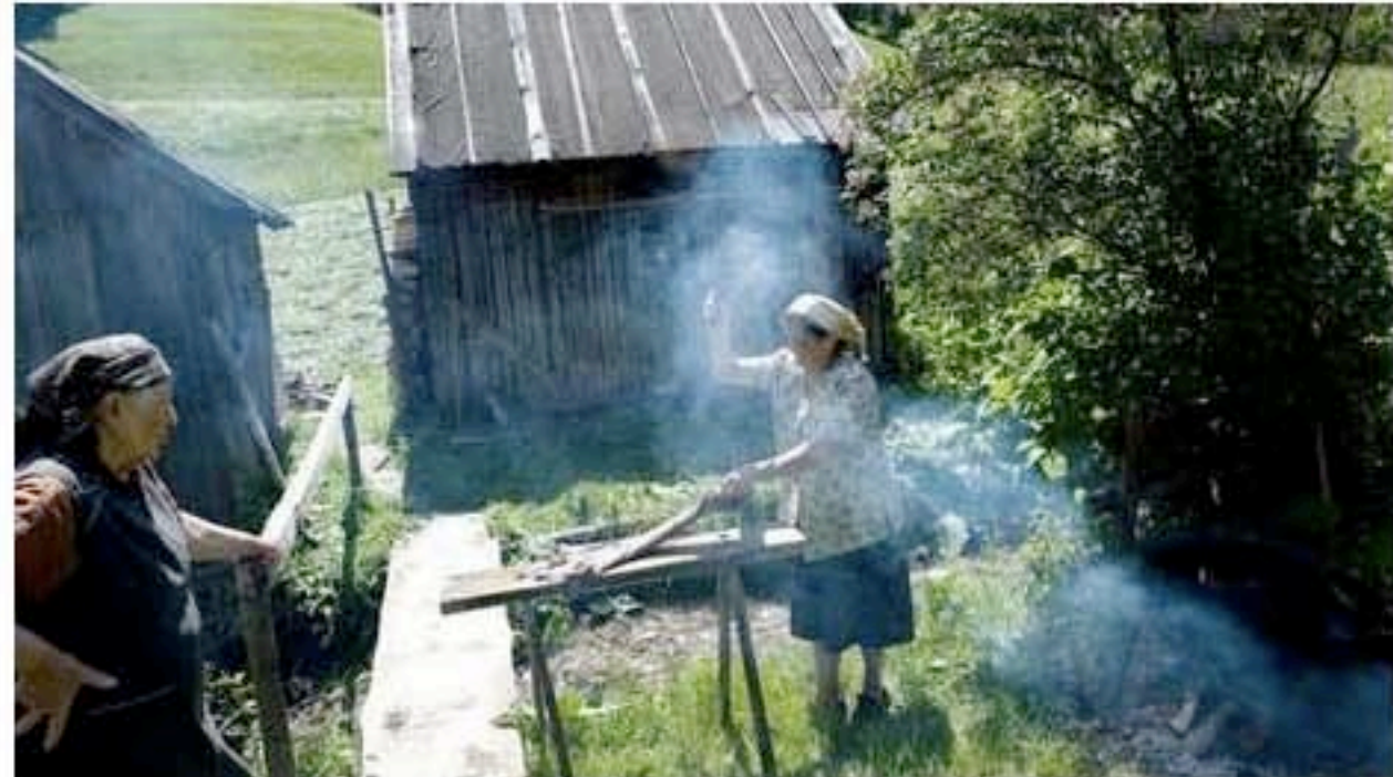
Vrouwen in Hongarije wassen kleren. Typisch vrouwenwerk, vinden sommige partnerorganisaties.

Christelijke hulporganisaties uit Nederland hebben vaak liberalere opvattingen over gelijkheid tussen man en vrouw dan buitenlandse. Dat belemmert soms hun werk.